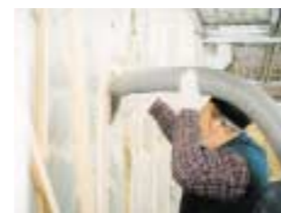
Seegrass kann als Dämm-Material eingblasen werden.