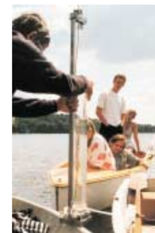
Interessiert verfolgen die Teilnehmenden eines Sommerworkshops, der in Zusammenarbeit mit der Berliner Humboldt-Universität durchgeführt wird, die Probenentnahme auf dem Feldberger Haussee.