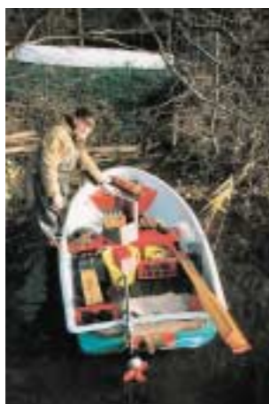
In einem kleinen Boot befinden sich die Gerätschaften für Probenahmen, die ausschließlich selbst hergestellt wurden. Die Seen der Feldberger Seenlandschaft werden für Probenentnahmen bis in Tiefen von 60 Metern befahren.