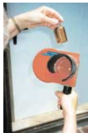
Die Grobbestimmung von Plankton erfolgt mit einer selbst erdachten bzw. erprobten Kuvette unmittelbar nach dem Fang.