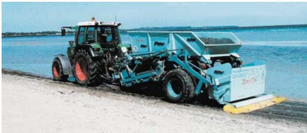
Prototyp eines in Kooperation mit einer Maschinenbaufirma modifizierten Strandreinigungsgerätes, mit dem die Strandreinigung Umwelt schonend erfolgen und Seegrass zur weiteren Verwertung gewonnen werden kann.