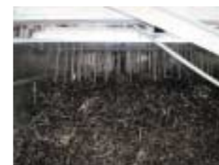
Prototyp einer nach dem Kamm- und Schüttelprinzip arbeitenden Reinigungseinheit, die als Teil der technologischen Kette zum Einsatz kommt.