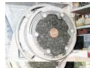
Prototyp eines Press-Schneidewolfs, mit dem Seegrass zerkleinert werden kann.