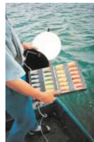
Regelmäßig wird die Wasserfarbe reproduzierbar und mit einer nach FOREL/ULE und durch BONITO erweiterten Farbstufenreihe auf einer weißen Secchi-Scheibe bestimmt.