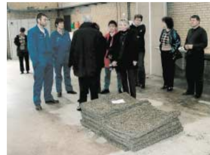
Prototyp-Präsentation eines ersten Stapels von Wärmedämm-Matten aus Seegrass, im Fließbandverfahren beim dänischen Partner in Sakskøbing hergestellt.

Die Küstengemeinden Europas unternehmen alle Anstrengungen, um ihren Gästen an den Badestränden einen hohen Erholungswert zu bieten. Dabei werden für die Strandreinigung und -bewirtschaftung viel Personal und erhebliche Finanzmittel eingesetzt. Neben dem Tages- und Touristenmüll wird in erheblichem Maß Seegrass und Algen angelandet. Dies wird im Rahmen der Strandreinigung aufgenommen und zum größten Teil auf Deponien verbracht. Hierbei entstehen den Gemeinden erhebliche Kosten, die durch die Entsorgung gebunden und anderweitig nicht eingesetzt werden können.