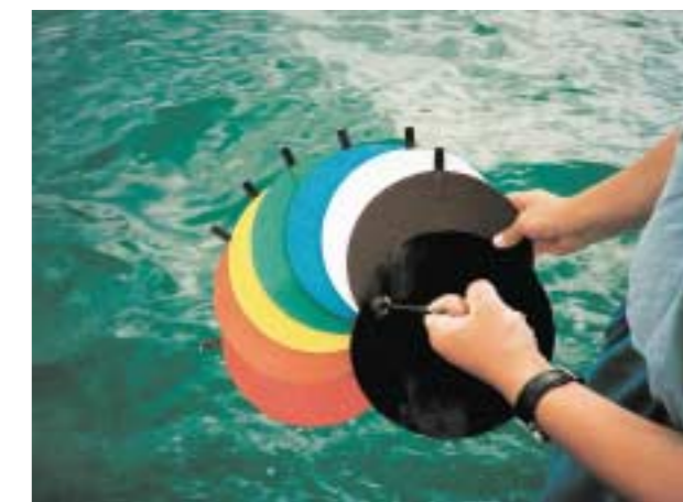
Zur einfachen Bestimmung des Lichtklimas im Wasser werden diese farbigen Sichttiefen-Scheiben benutzt.

Seit 1959 hat sich unter dem Dach der vier Jahre zuvor gegründeten hydrographisch-biologischen Arbeitsgemeinschaft BONITO e.V. eine Gruppe von Sporttauchern dem Motto „Umwelt- & Heimatforschung für den Umweltschutz“ in der Feldberger Seenlandschaft verschrieben. Das war kein Zufall, denn bei der Unterwasserfotografie und der Ausübung des Tauch-Hobbys war offensichtlich geworden, dass die Sicht unter Wasser rasant abnahm.