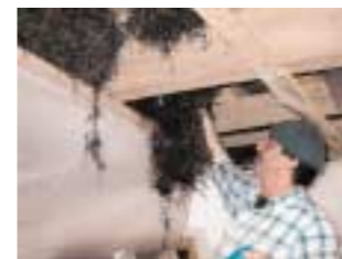
Seegrass kann in Zwischendecken gestopft zur Wärmedämmung genutzt werden.